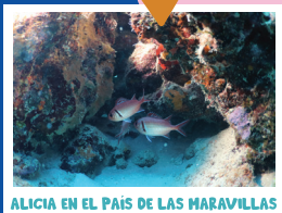
ALICIA EN EL PAÍS DE LAS MARAVILLAS